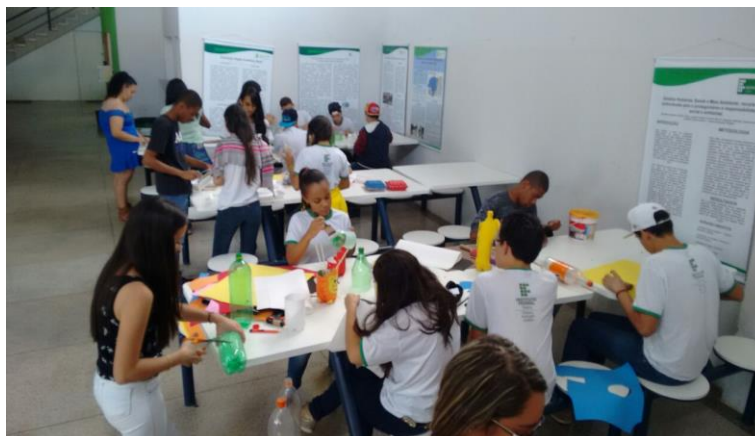
Figura 6: Oficina de reciclagem durante a II Mostra de Ensino, Pesquisa e Extensão do IFGoiano – Campus Avançado Catalão.

Os estudantes cadastrados no projeto realizaram uma oficina de reciclagem durante a II Mostra de Ensino, Pesquisa e Extensão do IF Goiano, Campus Avançado Catalão para os demais estudantes do Campus Avançado Catalão (figura 6).