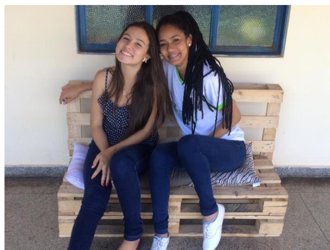
Figura 3: Estudantes sentadas no banco de palet fabricado por aluno participante do projeto de

A figura 3 mostra estudantes do Campus Avançado Catalão sentadas no banco de palet fabricado por um dos alunos integrantes do projeto.