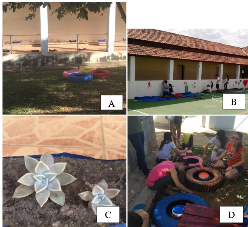
Figura 1: Visão geral das garrafas PET utilizadas para plantio de mudas e pneus após serem pintados (1A); estudantes pintando o muro do pátio da escola (1B); succulenta plantada no vaso feito com garrafa PET (1C); estudantes pintando os pneus que foram utilizados para plantio de mudas (1D).

garrafas PET após plantio das mudas e no local onde foram afixados (1A e 1C).