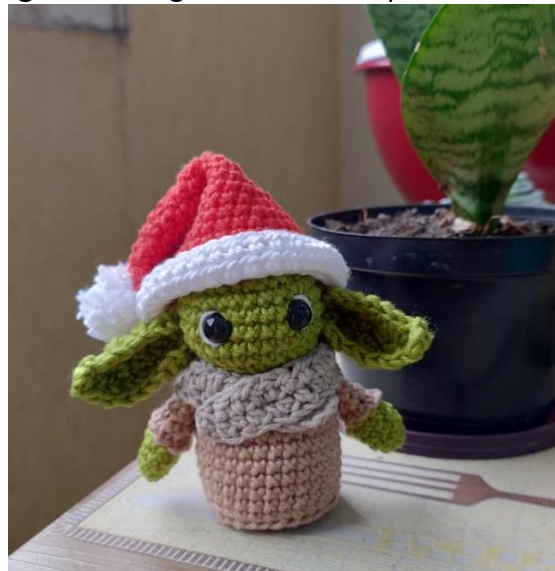
Figura 5- Amigurumi – Outras possibilidades.