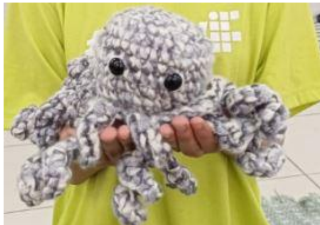
Figura 4- Amigurumi – Polvinho pronto 2 (linha mais grossa).