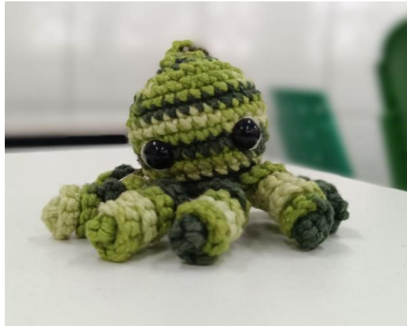
Figura 3- Amigurumi – Polvinho pronto 1.