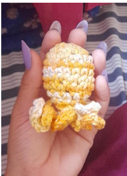
Figura 2- Confeccionando o corpo do polvo.