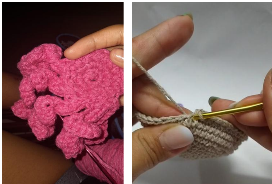
Figura 1- Confeccionando o corpo do polvo.