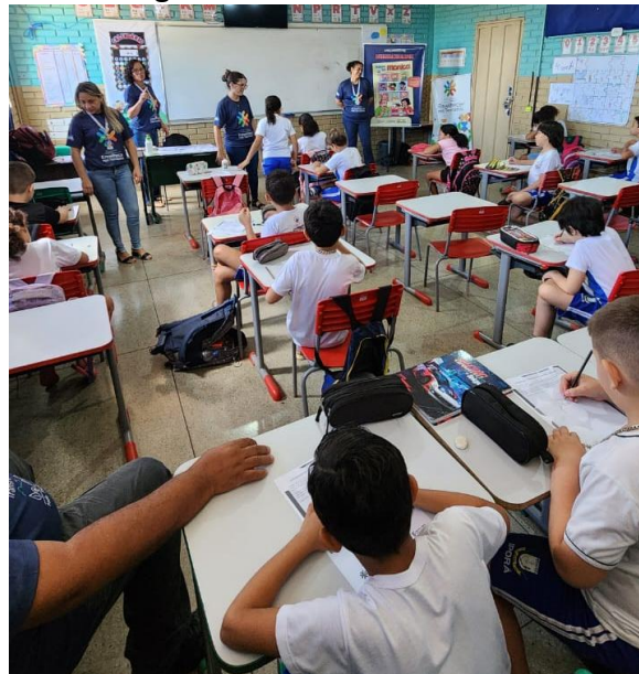
Figura 1 – Oficina em escola

Essa etapa foi marcada por uma escuta ativa e troca de experiências, buscando inicialmente vislumbrar como os alunos participantes enxergavam a pessoa idosa, qual era a imagem que elas tinham da pessoa idosa para, durante a roda de conversa, ressignificar conceitos e estereótipos associados à velhice. Após este momento de escuta com os alunos, foi solicitado que eles desenhassem uma pessoa idosa e escrevessem cinco características que, segundo eles, representasse esse grupo. Essa atividade permitiu observar as percepções iniciais das crianças sobre o envelhecimento.