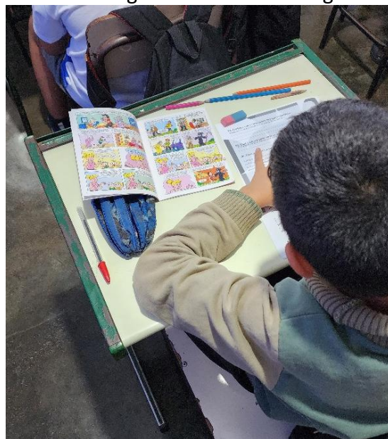
Figura 2 – Aluno lendo gibi

mediação da leitura constituiu um elemento central: a cada um ou duas páginas, pausávamos a leitura e fazíamos uma interpretação coletiva do texto, promovendo a reflexão sobre os temas apresentados e sua relação com situações vivenciadas pelos alunos. A etapa da leitura foi sucedida por atividades lúdicas de interpretação de texto, com foco nos direitos da pessoa idosa e nas relações intergeracionais. As atividades incluíram jogos e exercícios como caça-palavras, afirmações de (V) verdadeiro ou (F) falso, complete as lacunas com palavras do quadro, associação de ideias, pintura de conceitos, promovendo uma aprendizagem mais dinâmica e significativa. Todas as atividades foram planejadas para garantir a participação efetivas de todos os alunos, típicos e atípicos (entendemos aluno atípico como aquele que possui algum comprometimento no desenvolvimento neurológico, comportamental ou físico, podendo ter necessidades educacionais especiais), possibilitando que cada um pudesse realizá-las com autonomia e sem dificuldades, assegurando, assim, a inclusão e o protagonismo de todos no processo de aprendizado.