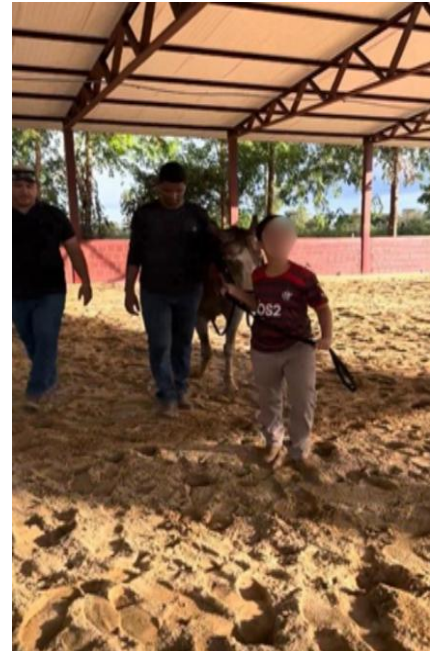
Figura 8: Praticante sempre disposto a realizar atividades diferentes.