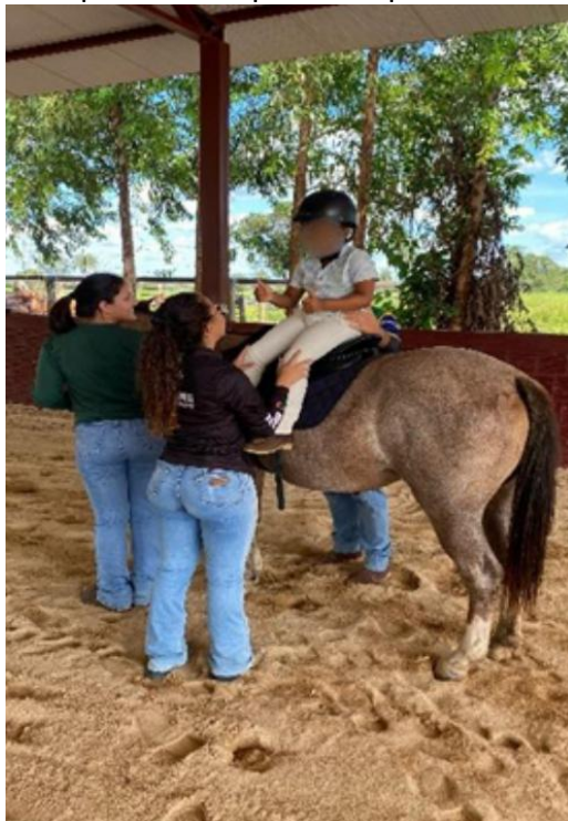
Figura 3: Praticante realizando atividades que eram impossíveis para ele.

Recomendou-se a continuidade do acompanhamento, com foco na consolidação das conquistas já alcançadas e no estímulo ao desenvolvimento de novas competências, incluindo maior autonomia nas atividades e ampliação da capacidade de planejamento e antecipação.