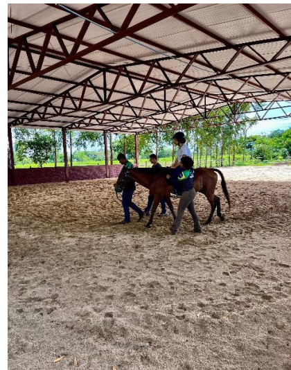
Figura 14: Praticante realizando o atendimento.