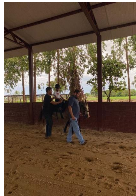
Figura 10: Praticante em seu primeiro atendimento.