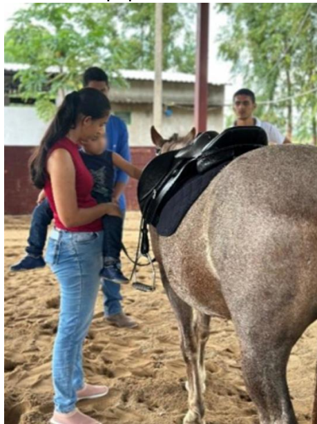
Figura 15: Praticante no seu primeiro atendimento, o primeiro contato com a equipe e animal.

Registra-se, portanto, que os desafios apresentados pelo praticante demandariam um período maior de trabalho terapêutico, com foco em estratégias de acolhimento, construção de vínculo e manejo das frustrações, para que houvesse maior adesão e aproveitamento das sessões.