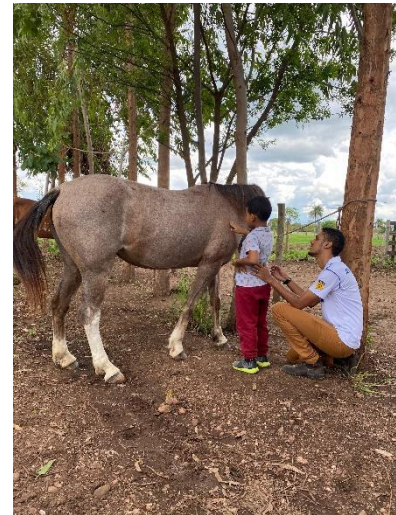
Figura 2: Primeiro contato do praticante com o animal.