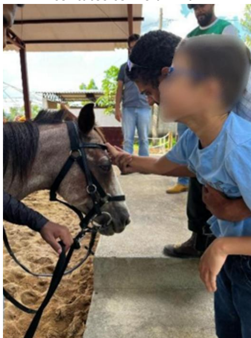
Figura 9: Praticante nos seus primeiros contatos com o animal.

Recomenda-se a continuidade do processo terapêutico, com foco na consolidação da marcha assistida, no fortalecimento muscular e na ampliação da comunicação não verbal e da autonomia funcional. O acompanhamento segue sendo de extrema importância para o avanço contínuo do praticante.