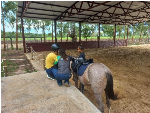
Figura 13: Praticante no seu primeiro contato com o animal.

Mesmo com a saída precoce, os avanços obtidos nas sessões frequentadas mostram que a equoterapia teve um impacto positivo na vida da praticante, especialmente no que diz respeito à regulação sensorial e ao estímulo da comunicação.