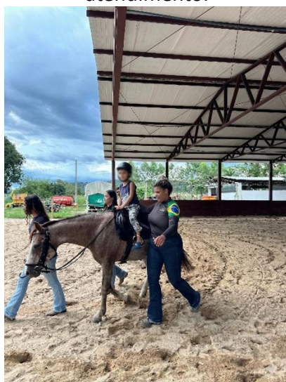
Figura 17: Praticante no seu primeiro atendimento.

Ainda assim, o período em que esteve presente demonstrou claros avanços, especialmente na superação de sua sensibilidade ao calçado e na interação ativa durante as sessões.