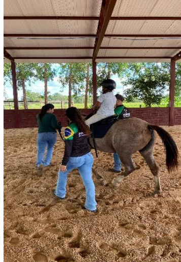
Figura 1: Atendimento com o praticante.

simulações de sessões terapêuticas, nas quais cada integrante da equipe desempenhava uma função específica, como equitador, lateral e mediador. Em 2024, os estudantes aptos, realizam os atendimentos (Figura 1):