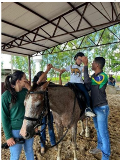
Figura 11: Praticante trabalhando a mobilidade e sustentabilidade no corpo.

Neste atendimento é notório que ele não tinha muita sustentabilidade no corpo.