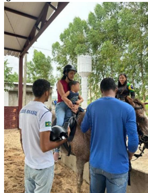
Figura 16: Praticante no atendimento.