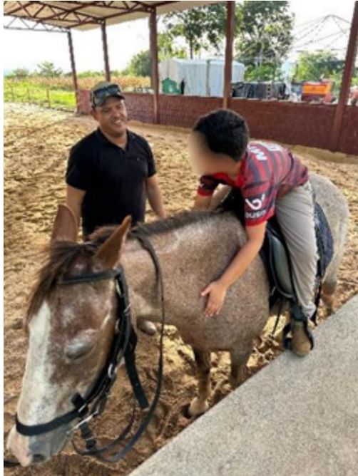
Figura 7: Praticante interagindo com o animal.