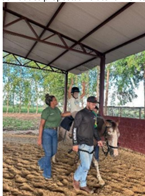
Figura 6: Praticante realizando as atividades propostas no atendimento.