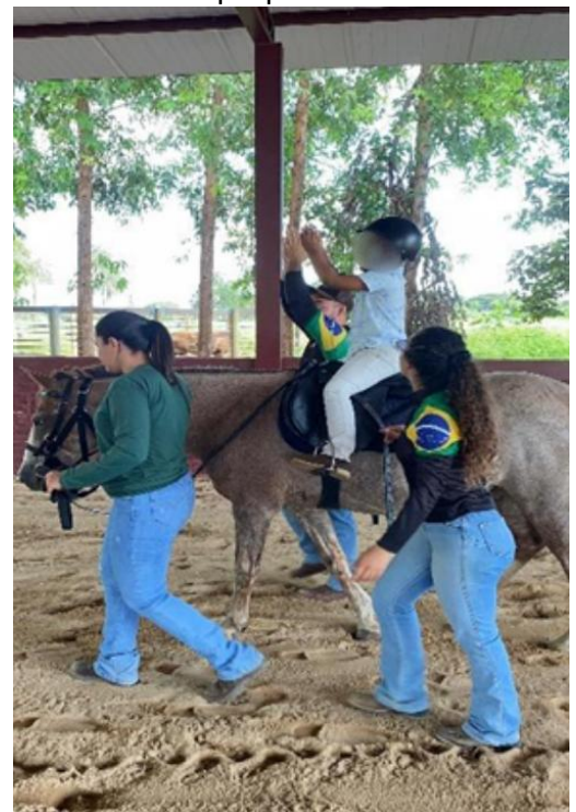
Figura 4: Praticante realizando atividades propostas.