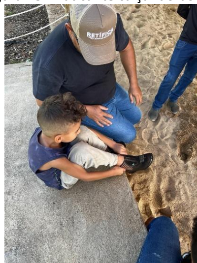
Figura 18: Praticante calçando botina.