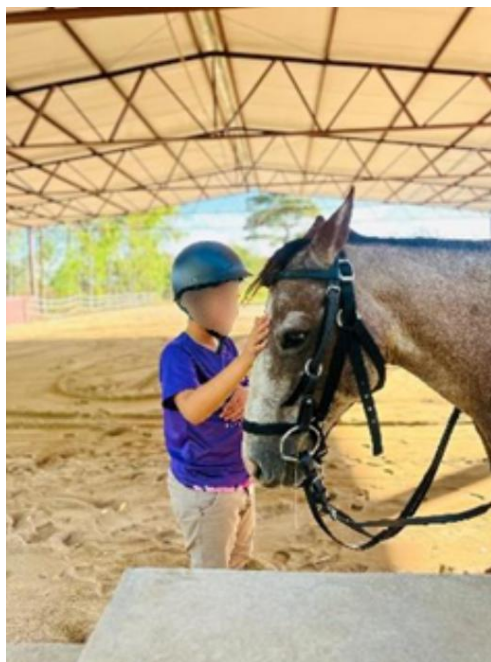
Figura 5: Praticante no seu primeiro contato com o animal.

A evolução do praticante dentro do programa de equoterapia tem sido positiva. Ele demonstra comprometimento com as atividades e vem superando desafios pessoais com o apoio da equipe multidisciplinar e da relação terapêutica com o cavalo. A continuidade do atendimento é recomendada, visando estimular ainda mais suas habilidades motoras, cognitivas, sociais e comunicativas.