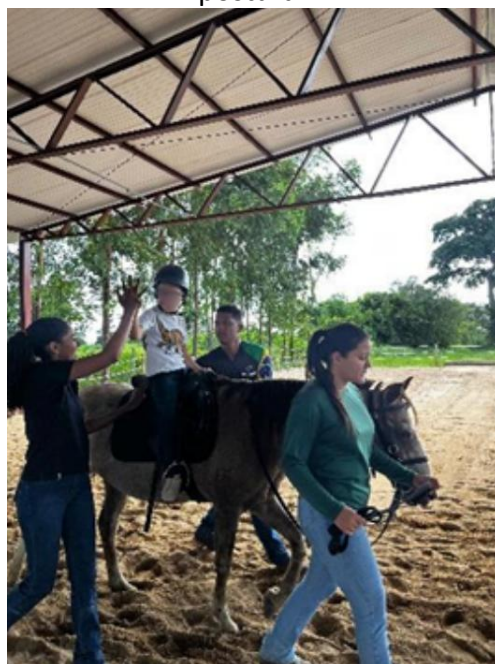
Figura 12: Praticante realizando as atividades propostas para desenvolver a mobilidade, a coordenação e equilíbrio postural.