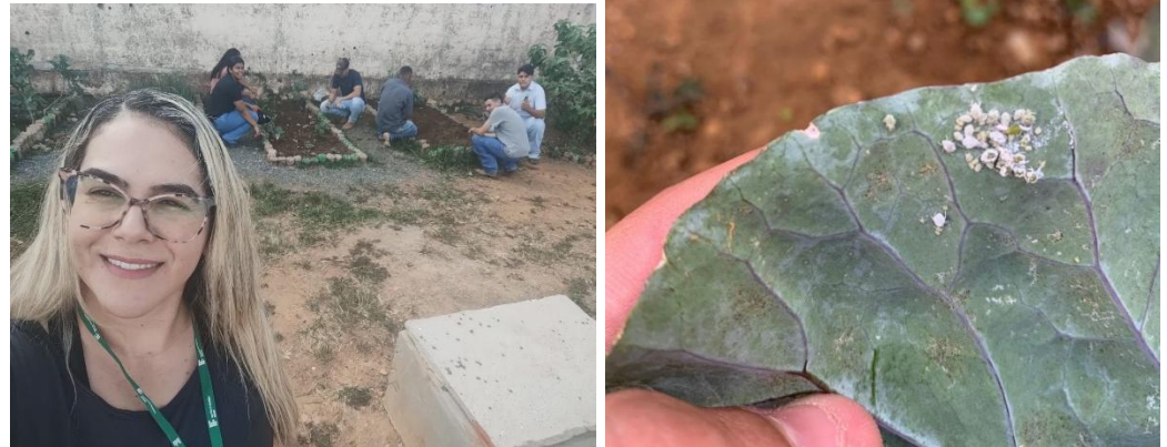
Imagem 2 – Identificação de Pragas e Doenças.

uso de insumos sintéticos e contribuindo para a saúde do solo. (MATOS et al., 2022)