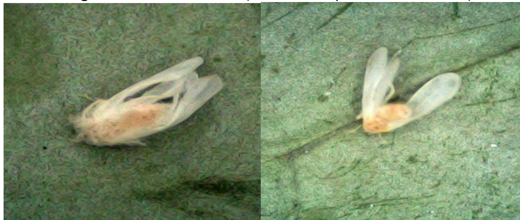
Imagem 3 – Mosca – Branca (Mortalidade pelo extrato de alho)

Segundo Plata-Rueda et al. (2017), o óleo essencial de alho e seus constituintes induziram sinais de intoxicação, necrose e até paralisia em insetos-praga, demonstrando que os compostos sulfurados do alho afetam o sistema nervoso e o metabolismo dos insetos.