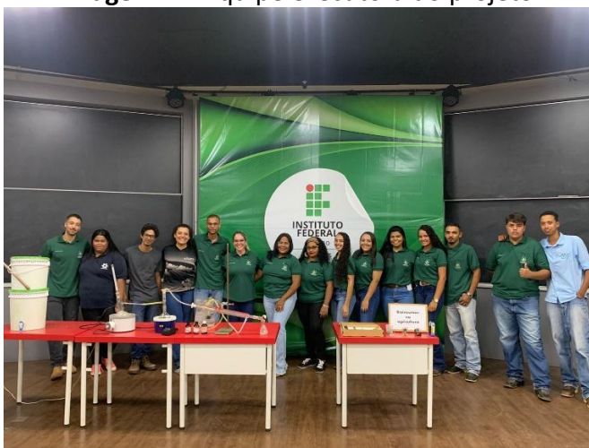
Imagem 1 – Equipe executora do projeto.

Primeiro passo deste projeto foi fazer o contato com as diretoras ou responsáveis pelas escolas, o que possibilitou uma conversa dinâmica sobre nosso propósito acadêmico e o retorno para a instituição. Contudo, sendo firmado entre as partes do projeto, demos início ao projeto.